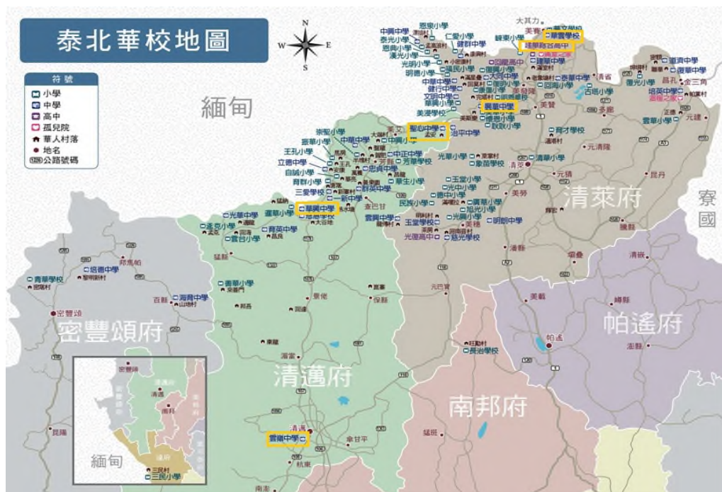
圖2 泰北地區僑校地圖

1、據僑委會函復 7 ，當地僑情特殊，我針對泰北地區僑務工作主要著重於僑教之推動；而在僑社方面，計有清邁雲南會館及清萊雲南會館2個僑民組織，泰北臺商同鄉聯誼會1個僑商組織，與我關係密切友好。另泰北地區104所僑校，分布於泰國清萊地區及清邁地區，清邁雲南會館及泰北臺商同鄉聯誼會位於清邁，清萊雲南會館則位於清萊。